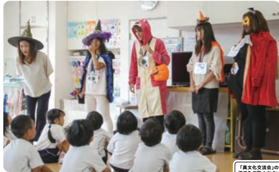
「異文化交流会」の様子をご覧ください

学んだ英語のアウトプットの場として、月に1回、岡山大学等の留学生さんや外国籍の方との交流をします。英語でゲームをしたり、出身国のお話を聞いたり、楽しくふれあひながら、自分の英語が通じた喜びを感じることができます。